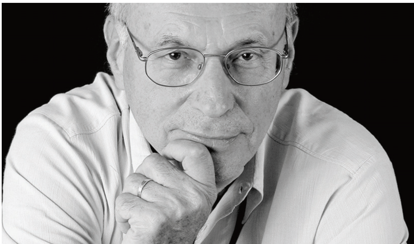
Boris Cyrulnik: «La haine donne du sens à la vie de ces gosses largués par leur famille, largués par leur culture.»