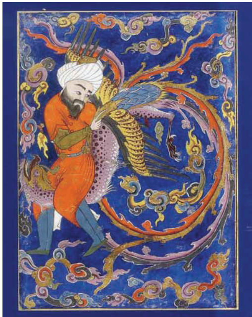
Miniature persane illustrant «Le Cantique des oiseaux» d'Attâr. Un récit initiatique traduit par Leili Anvar. ED. DIANE DE SELLERS 2012

Tout cet engouement est fondé sur un profond malentendu. Les gens pensent qu'ils peuvent aller tout de suite au bout du chemin. Mais la méditation, le «lâcher», «vivre le moment présent», tout cela ne s'acquière pas sur prescription médicale, c'est le travail d'une vie. ○