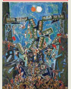
Friedrich Dürrenmatt: «La catastrophe», 1966, huile et gouache sur toile, 56x76 cm (DN)

année dürrenmatt A la (re)découverte d'un Suisse universel