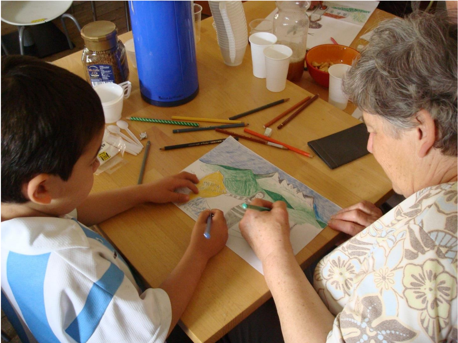
Collaboration entre les générations.