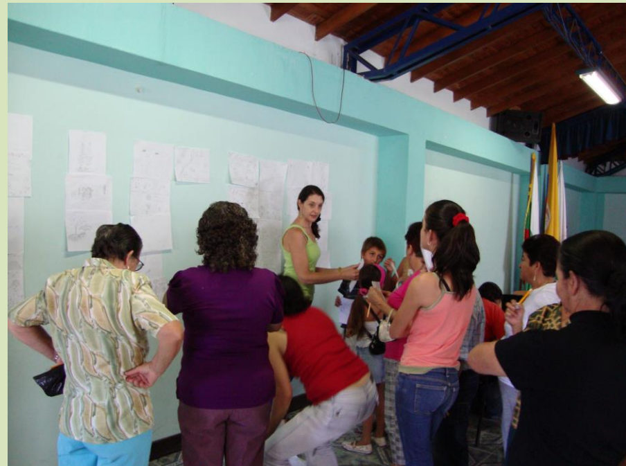
Cultural House Cocorná, Antioquia