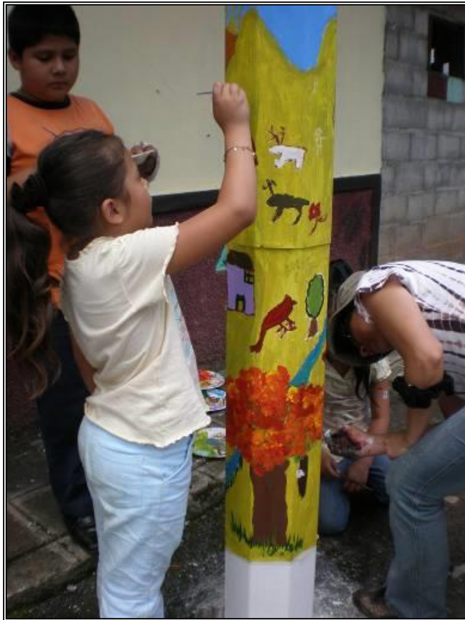
Public Art and Urban Intervention regarding the Rights of Children and Protection to the Environment