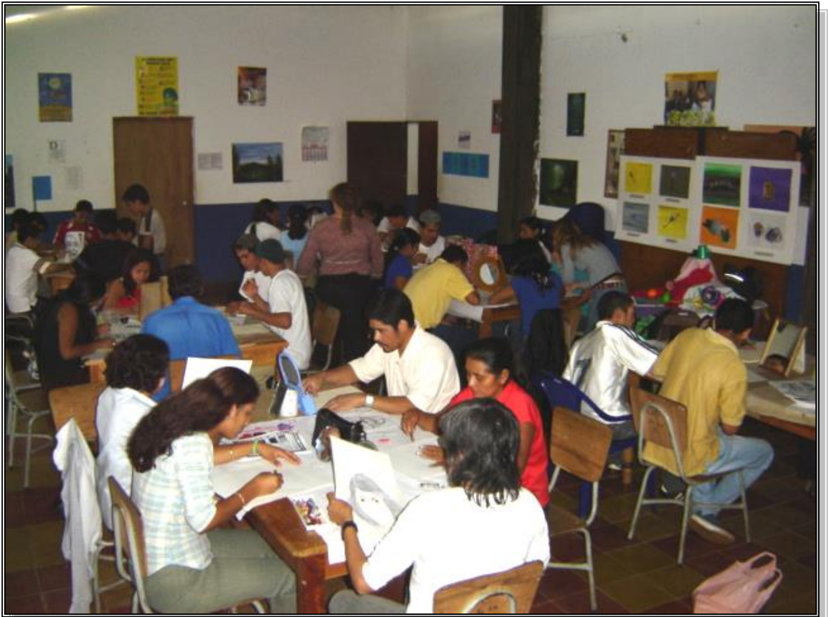
Painting and Drawing Workshops for Youth and Adults