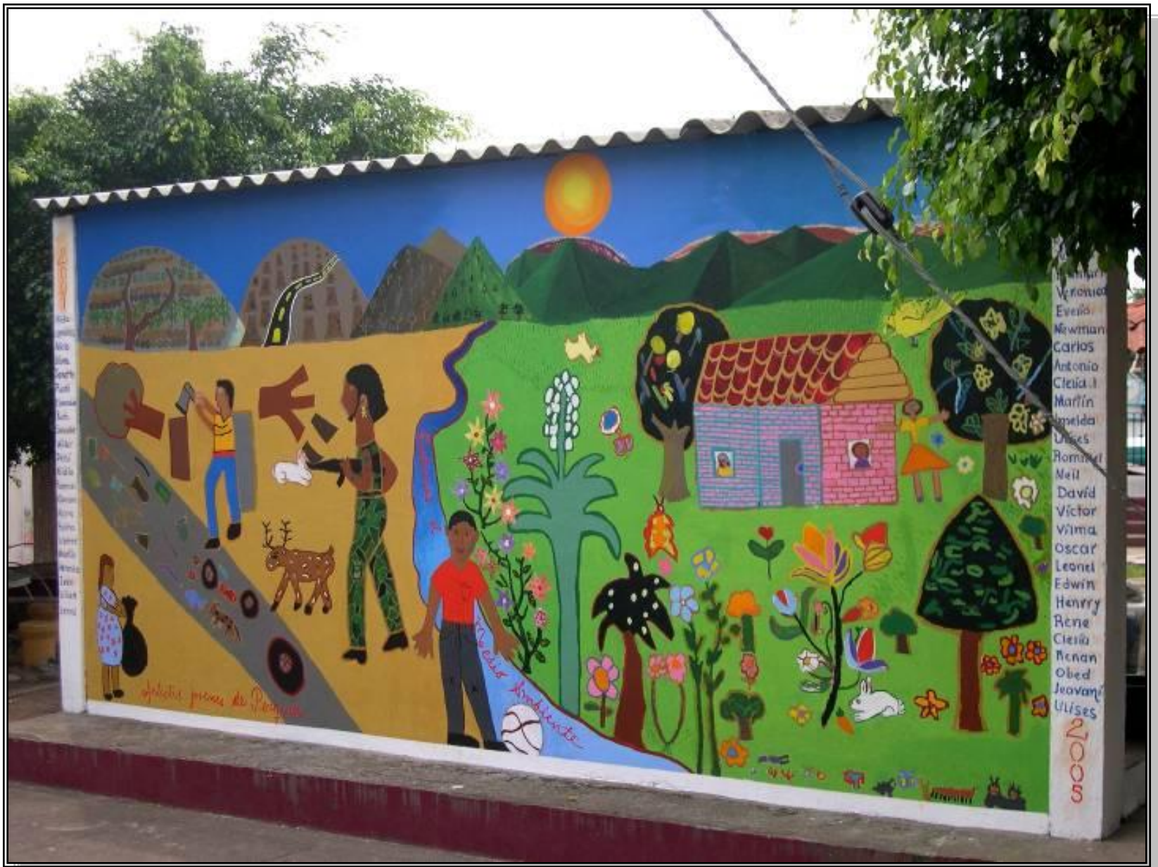
Mural about the Environment, Perquin