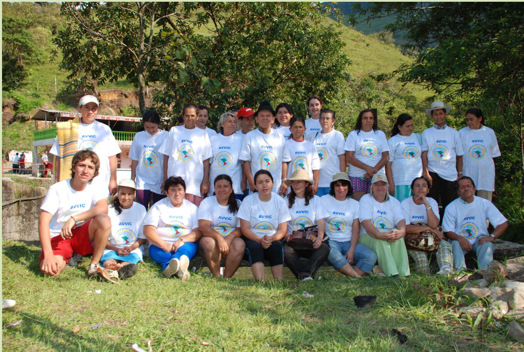
AVVIC, Association of Victims of Violence in Cocorná, Antioquia, Colombia August 1-15, 2009