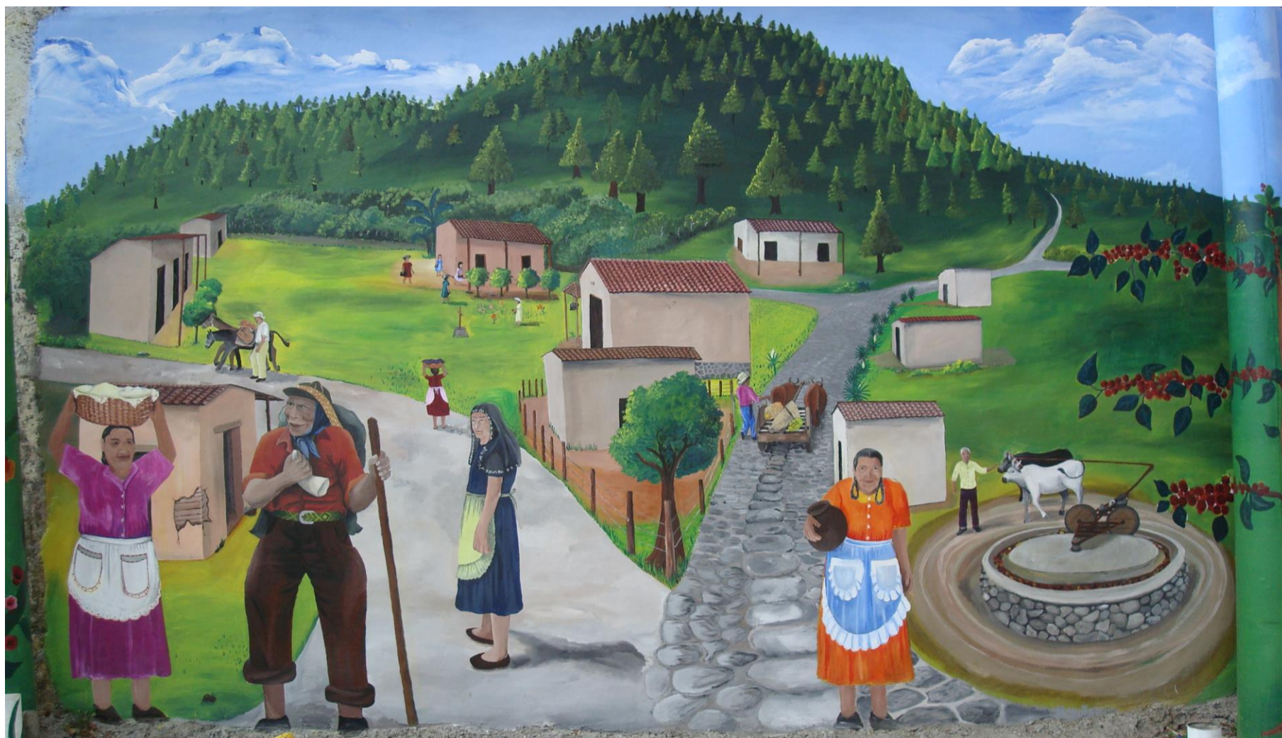
Memorias de los Niños de Ayer/ Memories of Yesterday' s Children