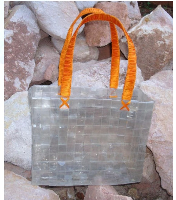
Workshops with Recycled Materials