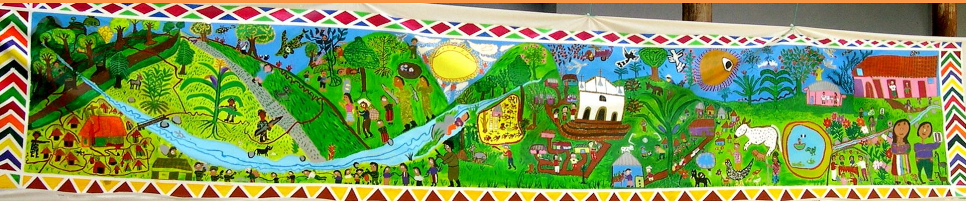
Collaborative mural created by survivors of state violence in Guatemala Psychosocial Workers, ECAP and the School of Art and Open Studio of Perquin