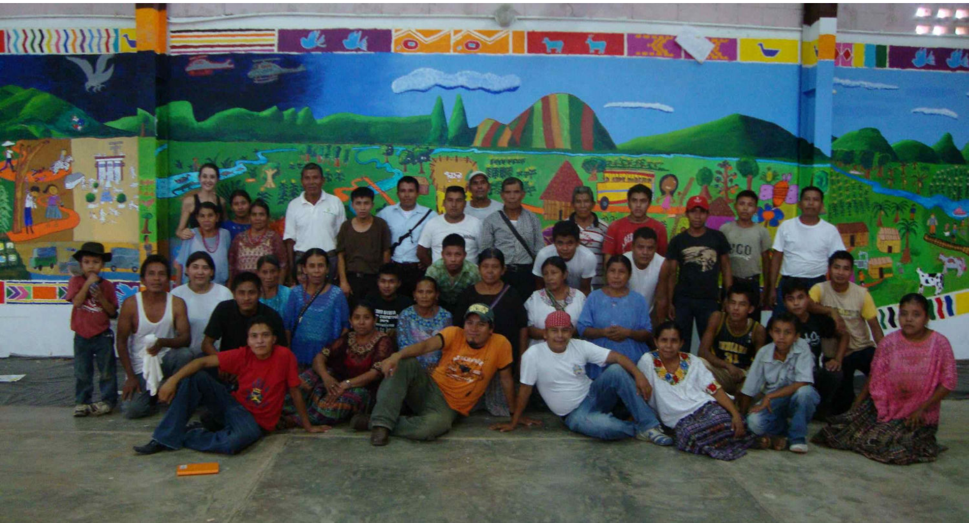
Artists from Panzos