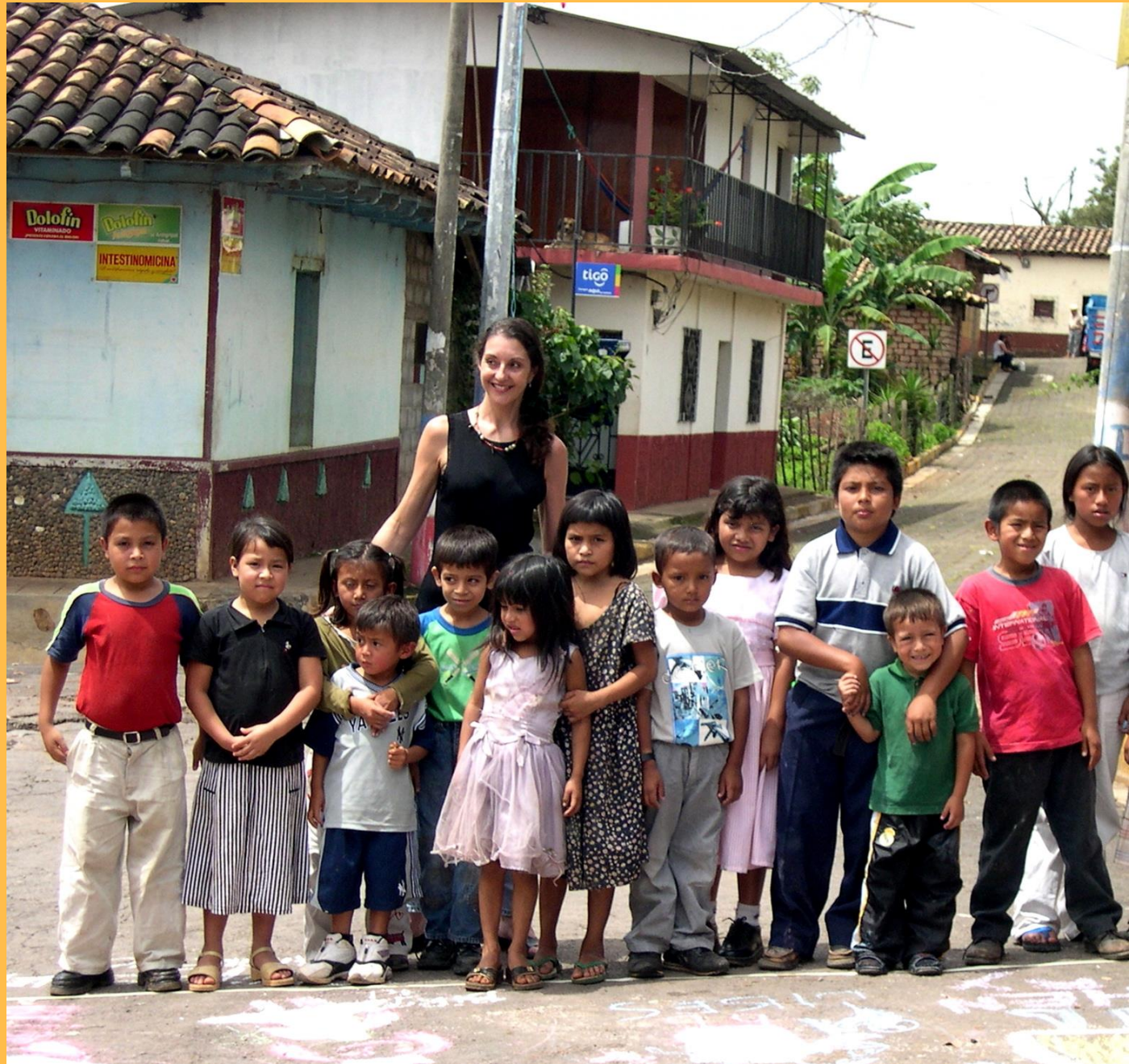
Walls of Hope, PERQUIN