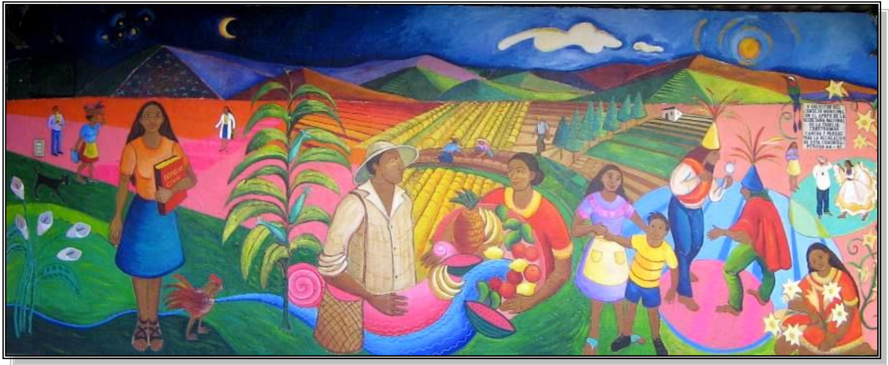
Mural in the Central Park of Perquin