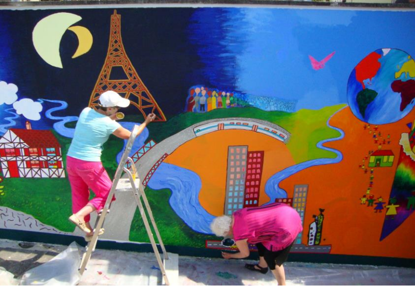
France and Switzerland