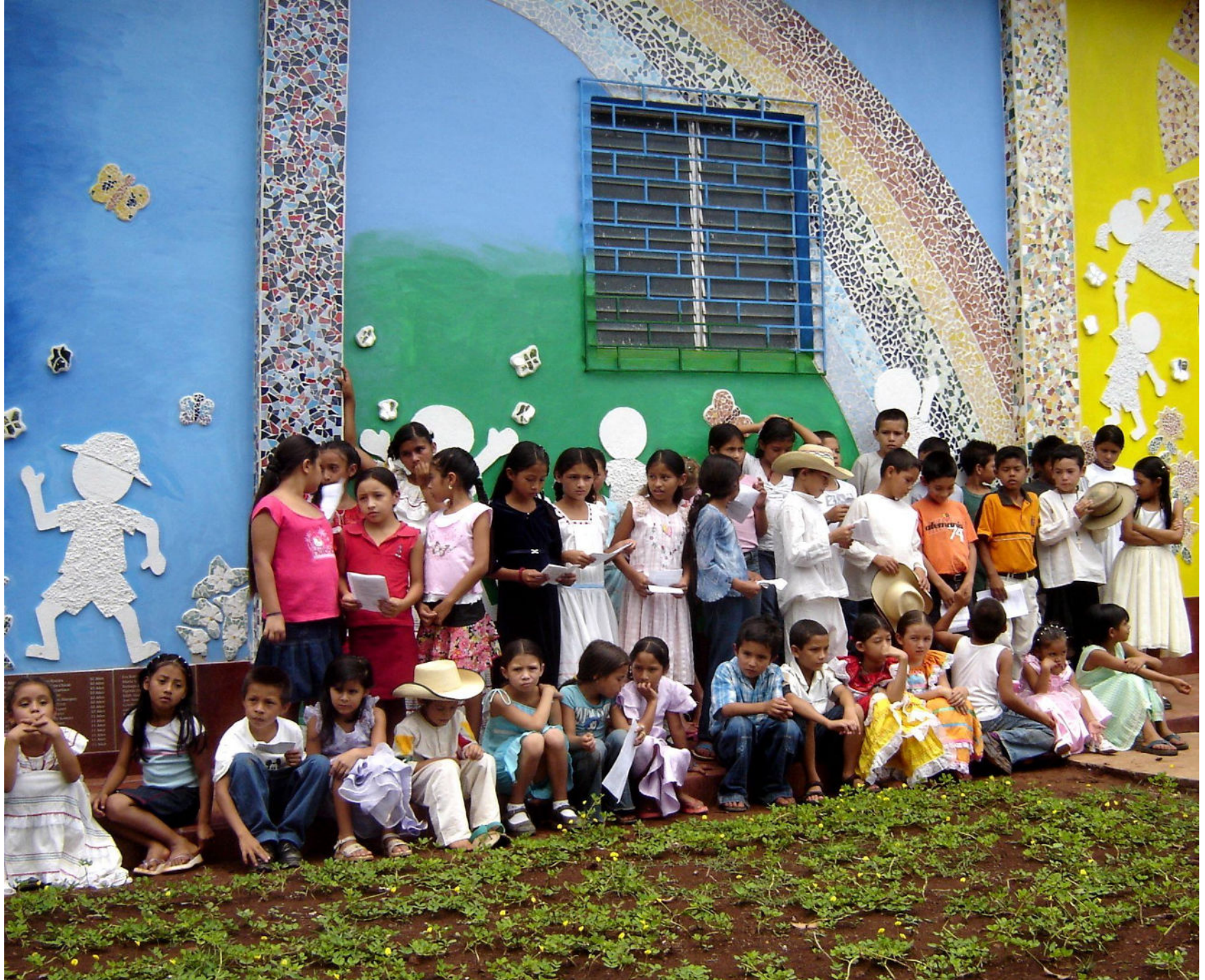
Children of El Mozote, 2012