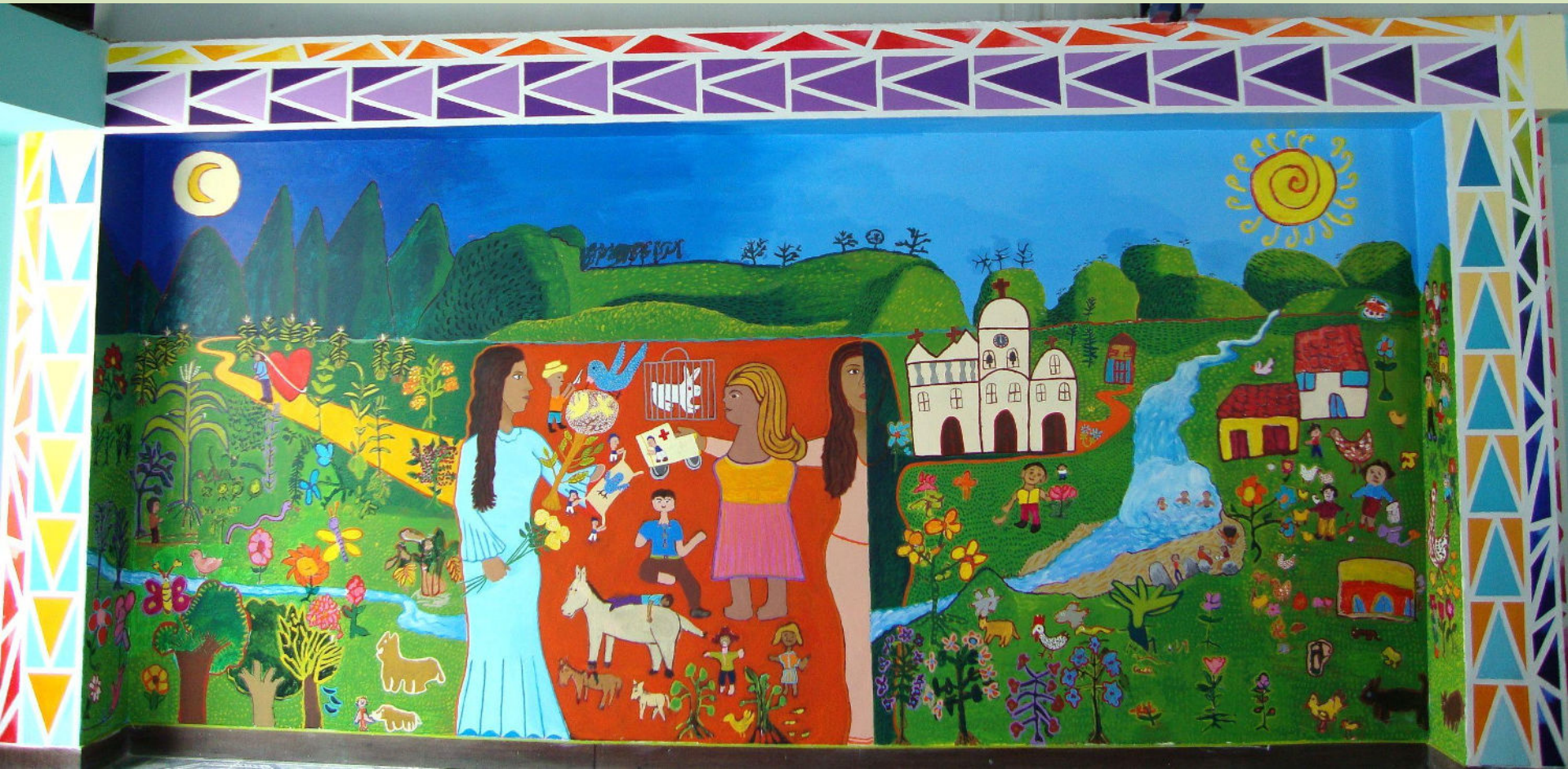
Mural : “Half of Myself/ La Mitad de Mí “