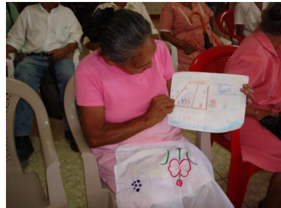
Abuelitos y Abuelitas de Perquin