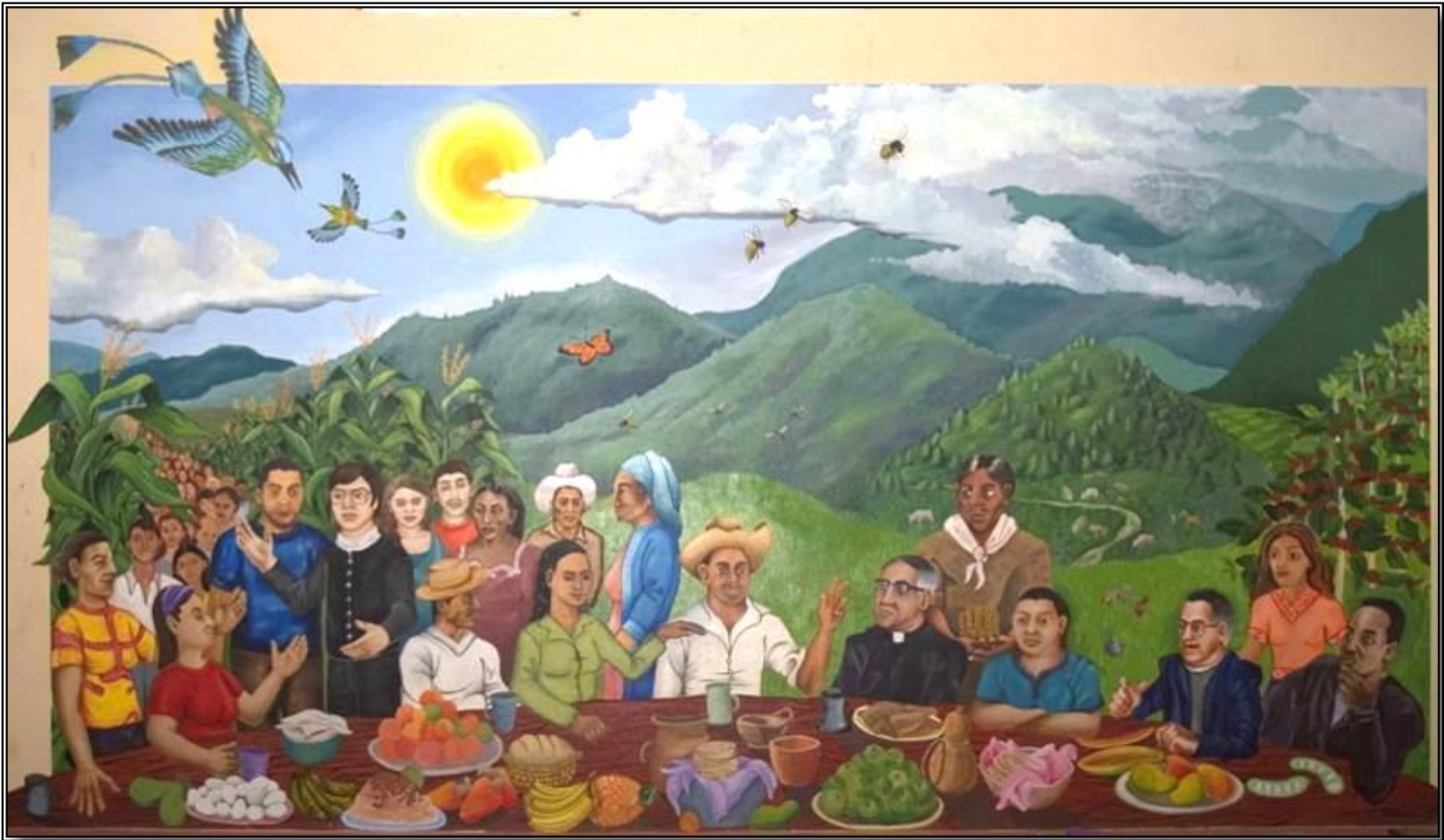
LAST SUPPER OF MORAZAN Mural at the House of CEBES, Perquin