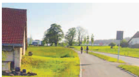
La seule partie du chemin des Rencontres, réalisée sur 1,8 kilomètre. SP

Un badge de soutien à six francs permet de prendre (avec son vélo) ces navettes, mais aussi de profiter de «sites et curiosités souvent méconnus». Ce sésame vraiment pas cher ouvre la porte des musées en chemin (paysan à La Chaux-de-Fonds, du château des Monts au Locle, de la Montre à Villers-Le-Lac et d'horlogerie à Morteau), mais aussi la loco du père Frédéric aux Brenets, la