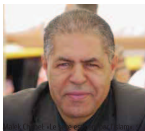
Malek Chebel, «Le kama-sutra arabe»

L'héritage hédoniste des Bédouins du Hedjaz (Arabie saoudite), qui célébraient l'art d'aimer dans une surenchère verbale extraordinaire, ne sera pas renié avec