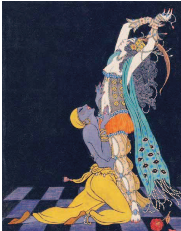
Shéhérazade, incarnation du désir féminin.

Mais je ne suis pas en porte-à-faux avec l'islam. Cette religion, contrairement à d'autres, n'a jamais condamné les plaisirs