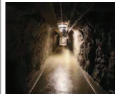
Au cœur des réserves d'or. SP

Les Suisses ont caché de l'or durant la Seconde Guerre mondiale au Gothard. Une exposition, à voir jusqu'au 19 octobre, se tient dans l'ancien fort utilisé par les autorités, lors du dernier conflit mondial, pour cacher la réserve d'or. L'exposition «Gold Oro Oro» évoque les raffineries d'or de Suisse, mais aussi l'alchimie, la géologie, les personnages de contes de fées. L'attraction principale dans le fort militaire reste toutefois l'exposition permanente, multimédia, sur la gestion des ressources naturelles. ● ATS