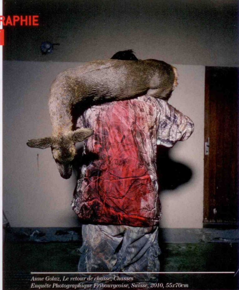
Anne Golaz, Le retour de chasse , Chasses, Enquête Photographique Fribourgeoise, Suisse, 2010, 55x70cm

Anne Golaz semble refuser la délivrance au spectateur, tant du moins qu'il ne s'est pas rendu hors du champ de la fascination qu'exercent ses œuvres. Loin de poser un regard moralisateur, ou d'imposer un parti pris, la photographe développe l'aspect véritablement esthétique de ce sujet qui confronte chacun à son propre rapport avec la chasse, face à la mort, entre effroi et fascination.