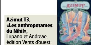
Azimut 3, «Les anthropotames du Nihil» , Lupano et Andreae, édition Vents d'ouest.

Fable steampunk aux airs de Lewis Carroll, le 3e opus d'«Azimut» nous embarque à nouveau dans l'univers poético-fantastique imaginé par Lupano. Une jeune femme ayant passé un marché avec la banque du temps pour obtenir la vie éternelle, fuit sa mère qui souhaite la tuer. Pendant ce temps, le Nord, incarné par un lapin blanc, rencontre une déesse de sable, alors que le Petighistan, royaume belliqueux, vient de déclarer la guerre aux pays voisins. Farfelu? Délirant? L'histoire, bien qu'abracadabrante, reflète des aspects absurdes de nos sociétés. En vrac, le rapport au temps qui s'écoule et le désir d'immortalité, la croyance aveugle en la technique et le caractère inéluctable des conflits humains. Le dessin précis et expressif d'Andreae colle parfaitement bien à ce monde saugrenu. Chaque planche regorge de détails, ce qui en fait un album à relire tant et plus. Bonus: les explications naturalistes d'animaux mi-mécaniques mi-organiques, telle la mouche gobe-temps ou le tapis à bosse. ●