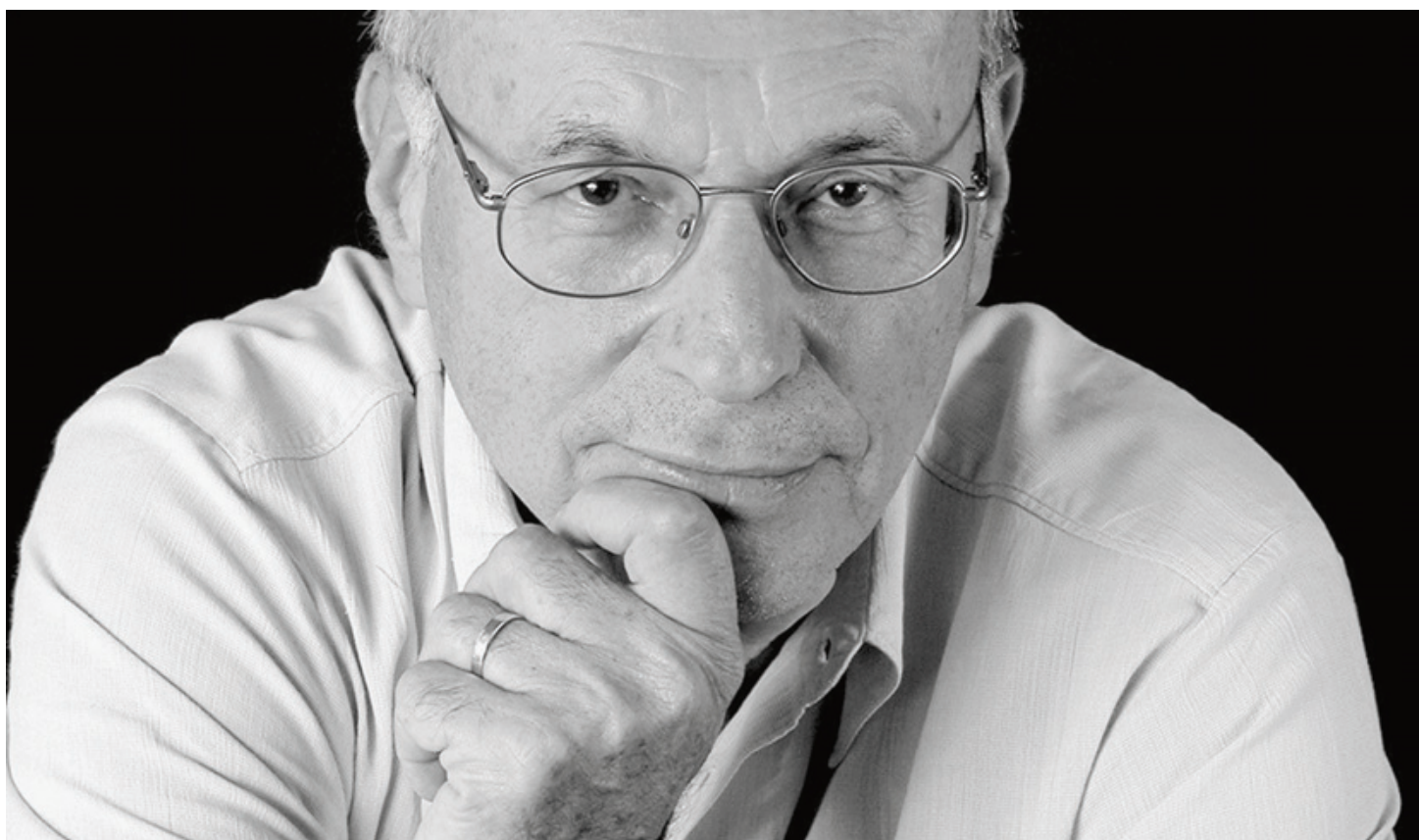
Boris Cyrulnik: «La haine donne du sens à la vie de ces gosses largués par leur famille, largués par leur culture.»