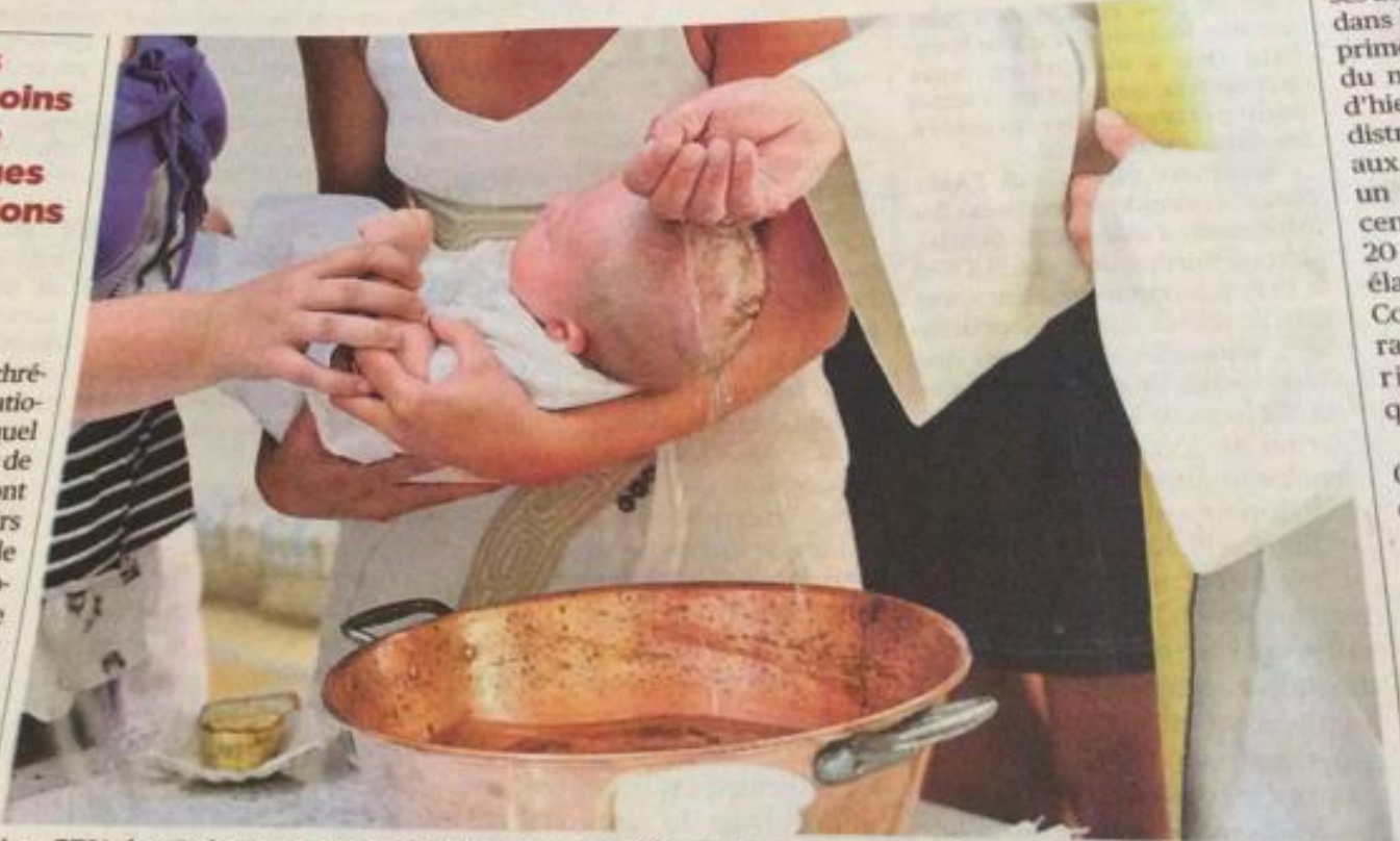
Les 57% des Suisses se trouvent dans une catégorie de personnes dites distantes face à l'Eglise. Ils baptisent par exemple leur enfant, mais cela n'a pas grande importance pour eux.

Les temps sont durs pour les chrétiens. Une étude du Fonds national suisse (FNS) montre à quel point les Suisses se distancient de l'Eglise. Le culte ou la messe sont en concurrence avec des loisirs aussi séculiers qu'un match de foot. Et une large partie de la population perçoit les religions de manière critique. Ces résultats sont publiés dans un ouvrage dont la version allemande vient de paraître et sa version française est attendue dans les prochains jours. Mais désormais, chacun décide en soi-même ce qu'il veut croire et comment il veut pratiquer sa religion. «L'individu est devenu roi», résume Gottfried Locher, qui a participé à cette étude. Les catholiques continuent de dire qu'ils vont à